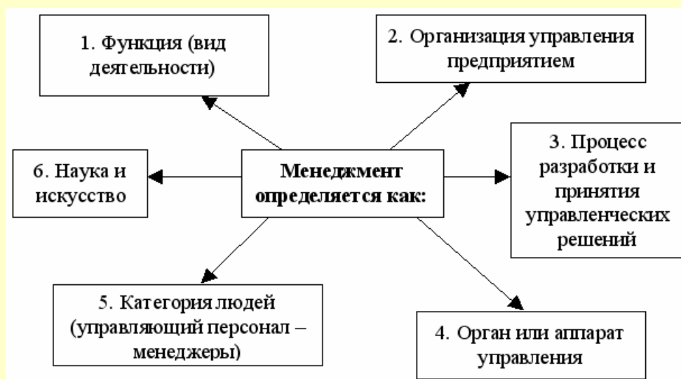
Рисунок 1-Определение менеджмента.

Итак, можно сказать, что менеджмент-это управление, руководство тем или иным производством. Менеджмент определяется как: функция (вид деятельности), организация управления предприятием, процесс разработки и принятия управленческих решений, орган или аппарат управления, категория людей (управляющий персонал), наука и искусство. Далее рассмотрим принципы управления.