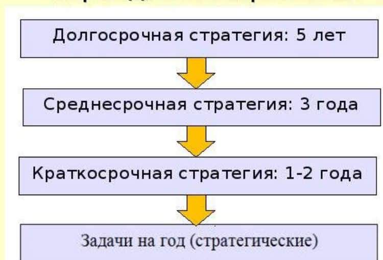
Рисунок 2-Периоды планирования.